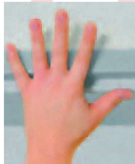
Die Hand lehnt offen am Türrahmen.